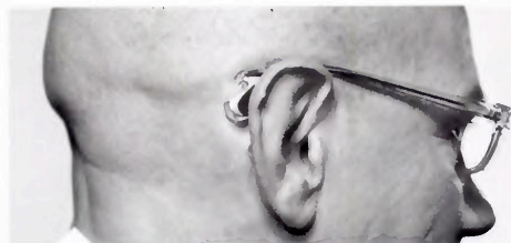
Un appareillage quasi invisible sur ce modèle de lunettes auditives