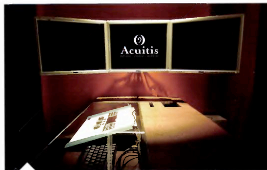
Chacun des deux espaces audition dispose d'un audiomètre, de cinq haut-parleurs circulaires restituant 17 positionnements de sons et 25 fréquences et de trois écrans haute définition avec visualisation des courbes du son en temps réel