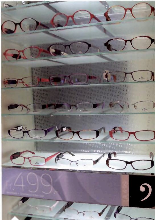
Des lunettes auditives très tendance! De quoi convaincre le jeune presbycousique de s'équiper à prix très doux (499 francs suisses – 299 € en France)